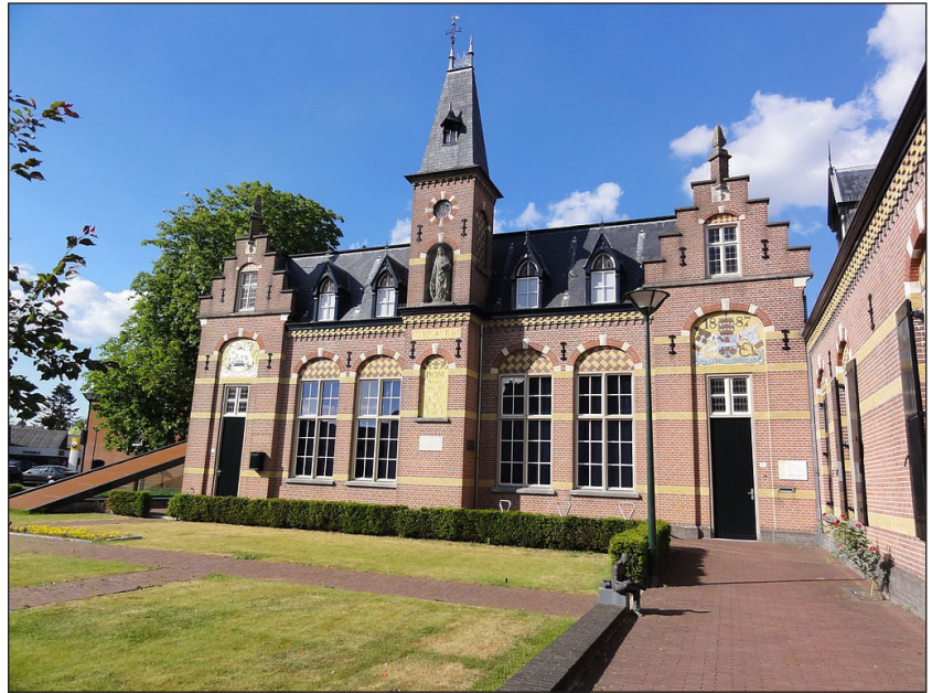
° De voormalige Commanderie en Latijnse school van Gemert

Tijdens deze 'Dag van de Brabantse Volkscultuur',