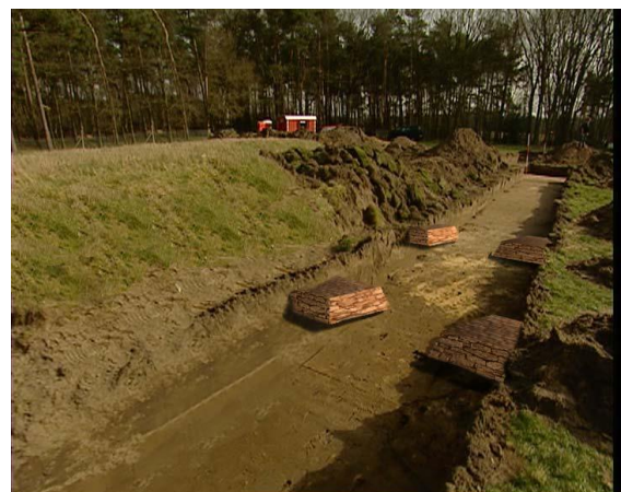
Opgravingen bij de Kerkenakker